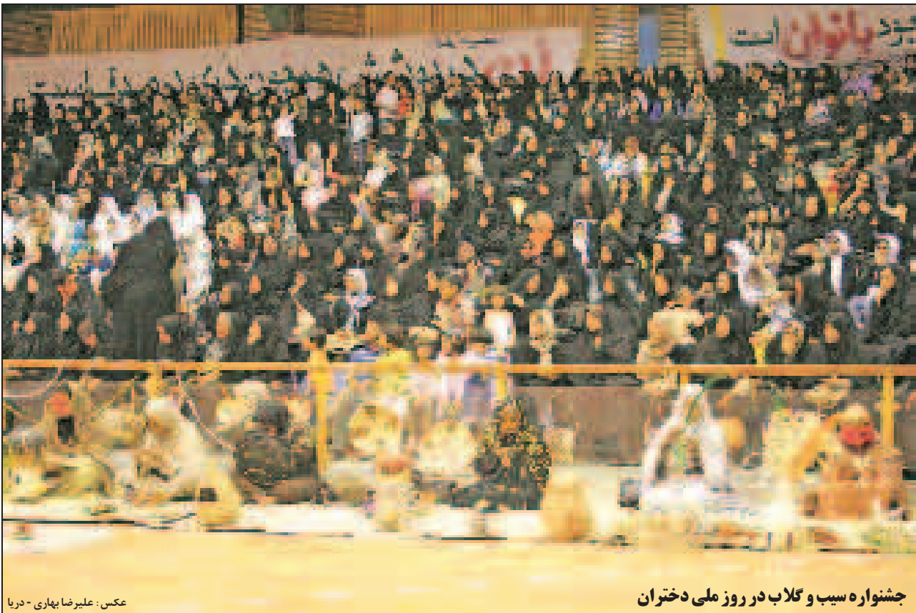
جشنواره سب و گلاب در روز ملی دختران