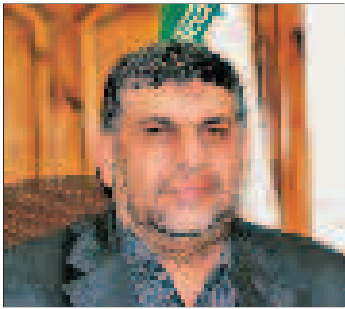
بندرعباس در گذرگاه توسعه