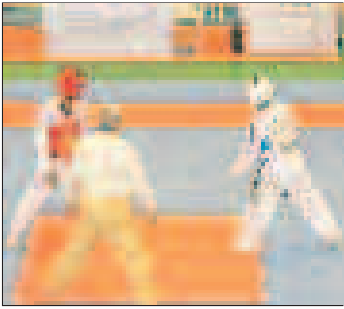
جام اقتدار خلیج فارس